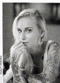
Annitotheka TATTOO STARLET 2017 und Model